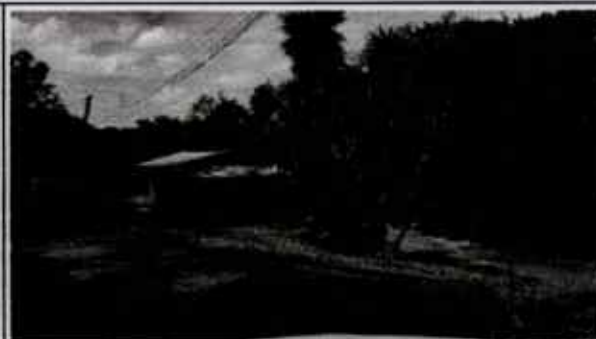
Casa 4 – parcialmente demolida