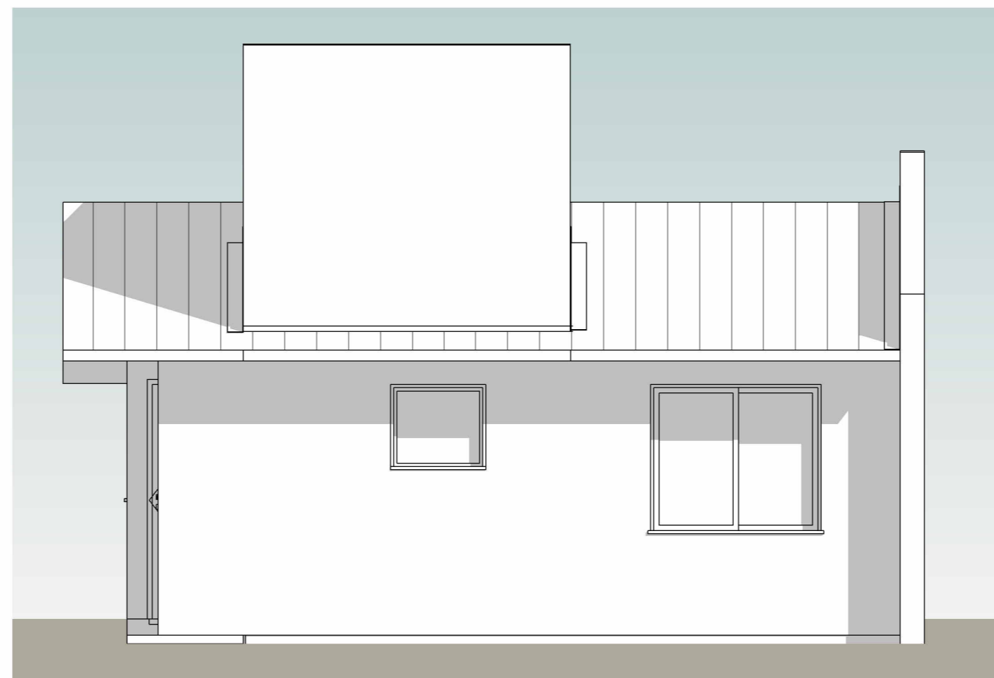
FACHADA FUNDOS | 1 : 50